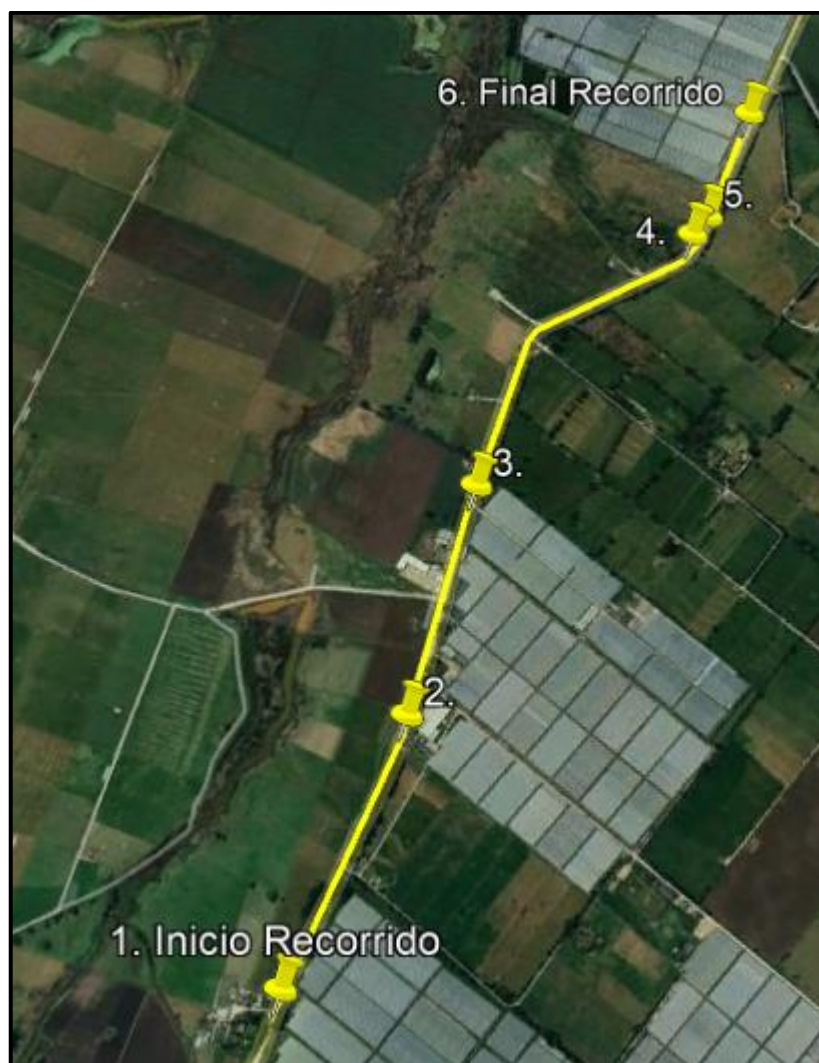
Ilustración 1. Recorrido de control y vigilancia en la vereda El Cocli.

Con base en lo anterior, el día 28 de agosto de 2024 se realizó recorrido de control y vigilancia en la vereda El Cocli desde las coordenadas 4°46'40.824"N - 74°13'14.244"O hasta las coordenadas 4°45'28.53"N - 74°13'24.966"O (ver ilustración 1. Ruta amarilla)