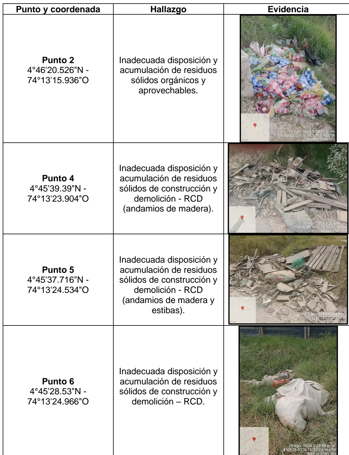
Tabla 1. Hallazgos recorrido de control y vigilancia vereda El Cocli.

En dicho recorrido, se evidenciaron las siguientes afectaciones ambientales: