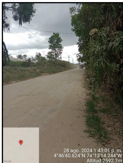
Ilustración 2. Evidencia recorrido, punto 1.

Adicional a ello, en los puntos 1 y 3 no se evidenciaron anomalías que afecten el componente ambiental propio del recorrido de control y vigilancia en la vereda El Cocli, como se observa en las siguientes ilustraciones: